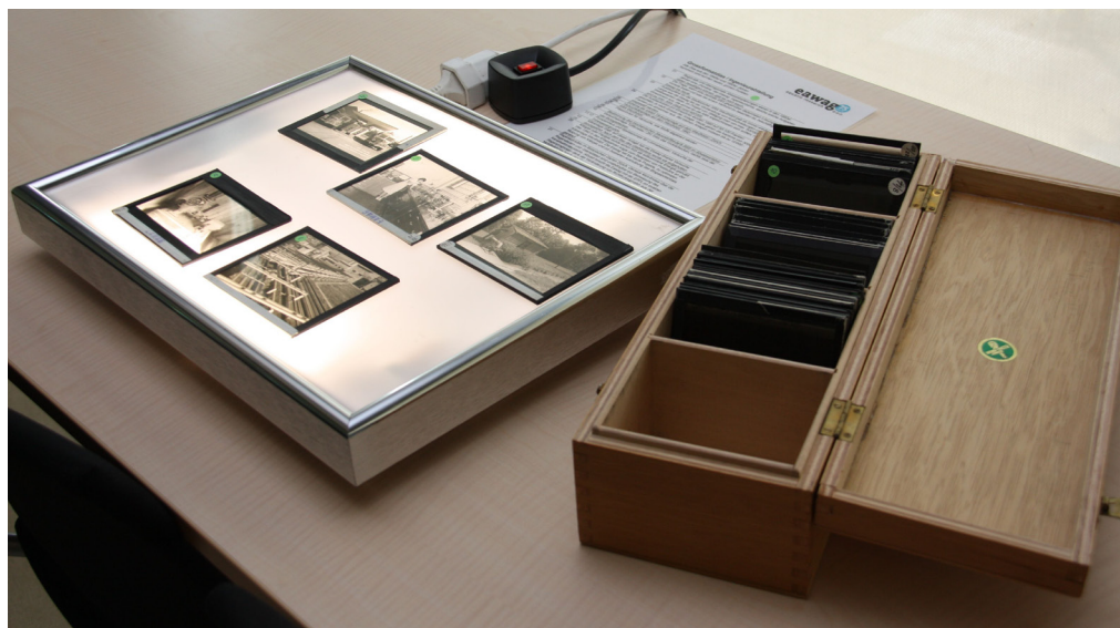
Vorlesungsvorbereitung wie vor 50 Jahren – Grossformatdias in der Lib4RI-Historienecke zum 75-Jahr-Jubiläum der Eawag.